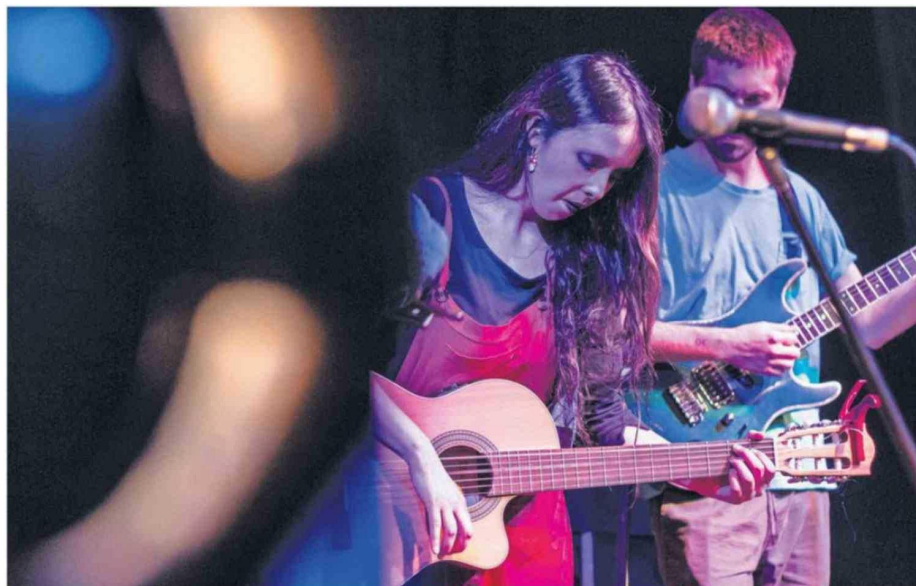
Bitácora Celeste tendrá un espacio central en la sexta versión del evento orientado en los sonidos del pop.

El valor de las entradas para asistir al evento artístico tienen un valor de $5.000 y están disponibles a través de Instagram @lacunadelpop. Mayores de 16 años.