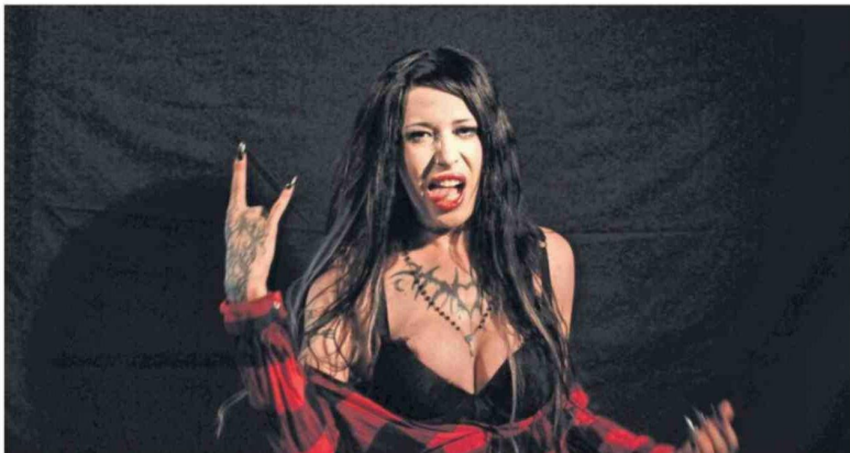
BBY M3rmaid integra la parrilla del festival con una propuesta que siempre llama la atención en escena.

Título: Festival La Cuna del Pop quiere darle espacio a todas las músicas