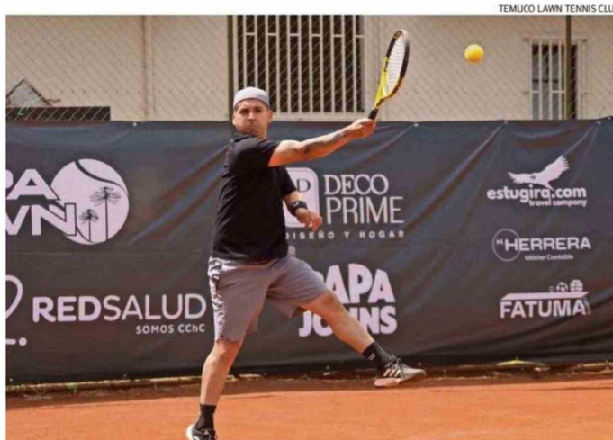
EN LAS CANCHAS DEL TEMUCO LAWN TENNIS CLUB SE VIVIRÁ LA SÉPTIMA FECHA DEL CIRCUITO.