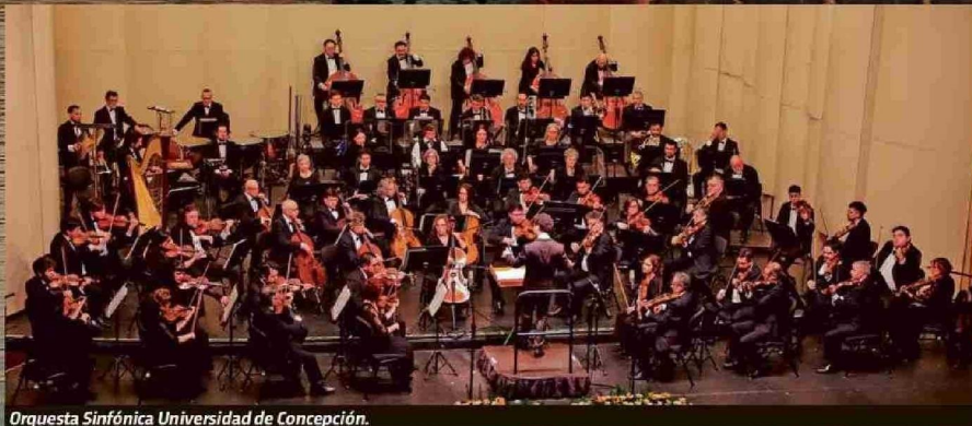
Orquesta Sinfónica Universidad de Concepción.