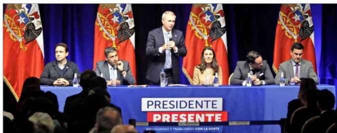
El Presidente estuvo la semana pasada en Puerto Montt en donde realizó la actividad "Presidente Presente", acompañado de la ministra de Educación, María Paz Arzola, y autoridades locales.

Una de las principales consignas de la campaña presidencial de Kast fue precisamente su despliegue territorial y el conocimiento de las distintas comunas del país. Ese énfasis no solo se mantuvo tras llegar a La Moneda, sino que se intensificó durante las primeras semanas de gobierno. A dos meses de asumir la presidencia, el mandatario ya acumula actividades en once regiones del país, además de viajes