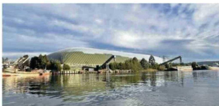
SE CAMUFLA EN EL ENTORNO PARA NO INTERRUMPIR EL PAISAJE.

la docente transformó esta gran infraestructura en un elemento que se integra armónicamente al ecosistema fluvial y urbano.