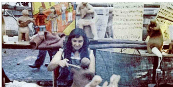
Violeta Parra en la Feria de Artes Plásticas, en el Parque Forestal, en 1959.

Los cuadernos tienen décimas autobiográficas, décimas sueltas y anotaciones.