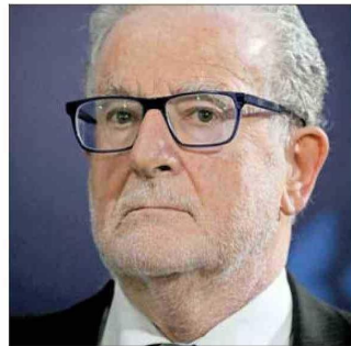
Roberto Zahler , expresidente del Banco Central.

En el encuentro se analizaron las implicancias fiscales de recorte del impuesto corporativo que propondrá el Ejecutivo y cómo golpeó las proyecciones macroeconómicas la fuerte alza en los combustibles que anunció hace dos semanas el ministro de Hacienda, Jorge Quiroz.