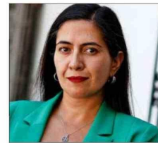
Karina Delfino, alcaldesa de Quinta Normal.