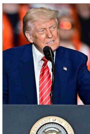
Trump anunció el 9 de abril una pausa arancelaria de 90 días.

"La generación de empleo mostró en el último trimestre móvil febrero-abril 2025 un dinamismo muy limitado, y el desempleo escaló a 8,8%, lo que refleja un mercado laboral que continúa debilitándose por falta de crecimiento", concluyó.