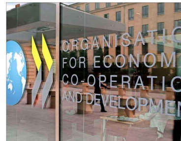
La organización está formada por 38 países, incluido Chile, y su sede está en París.

"El aumento de los aranceles impuestos anteriormente proporcionará un mayor apoyo a estas industrias y reducirá o eliminará la amenaza para la seguridad nacional que representan las importaciones de artículos de acero y aluminio y sus derivados", menciona la orden que la Casa Blanca publicó en X.