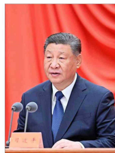
El Presidente chino, Xi Jinping, todavía no ha tenido ningún contacto desde que Donald Trump volvió al poder.

"Impulsar reformas estructurales para simplificar las regulaciones, mejorar los trámites de permisos e impulsar las habilidades y la innovación será esencial para impulsar el crecimiento de la inversión y la productividad", concluyó el informe de la OCDE.