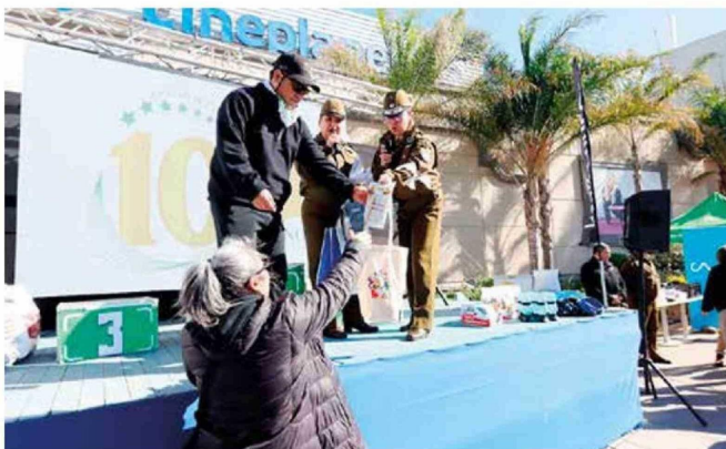
Hubo varias sorpresas y regalos para los entusiastas asistentes que llegaron a la cita.