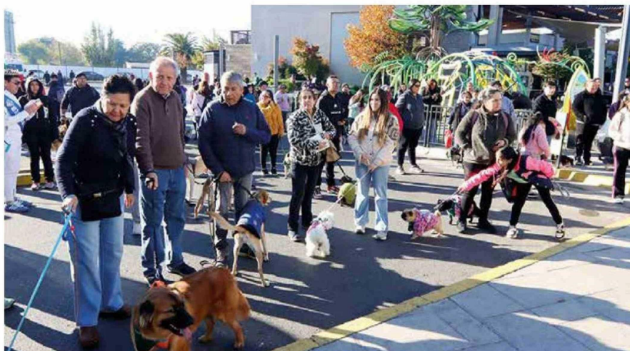
Mucha alegría y disposición hubo entre los participantes en la actividad.