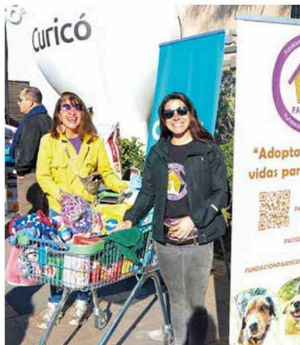
Representantes de Fundación Paticorta agradecieron apoyo.

EN EL MARCO DE UN NUEVO ANIVERSARIO DE CARABINEROS