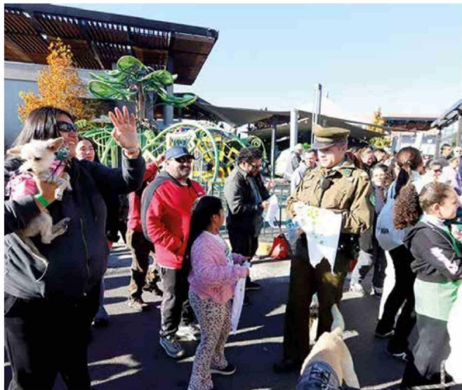
Caminata fue una instancia para que personal policial compartiera con los vecinos.