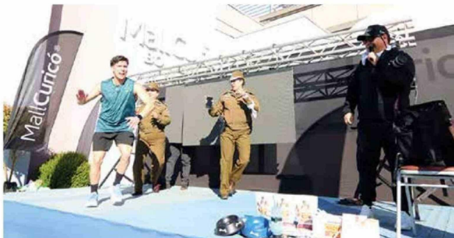
El evento también tuvo otras actividades anexas como baile entretenido.