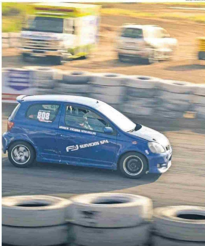
EL CERTAMEN ES VÁLIDO PARA LA FEDERACIÓN CHILENA DE AUTOMOVILISMO DEPORTIVO.