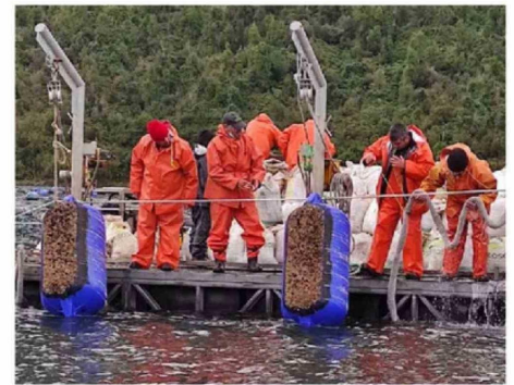
CHILOÉ CONCENTRA EL RUBRO MITILICULTOR TANTO EN LA REGIÓN COMO EL PAÍS.