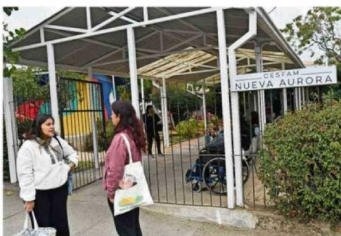
EL NUEVO SAPU DESCONGESTIONARÍA AL ACTUAL CESFAM