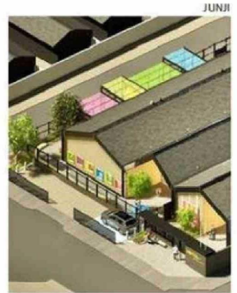
JARDÍN TENDRÁ CAPACIDAD PARA ATENDER A 84 PÁRVULOS.