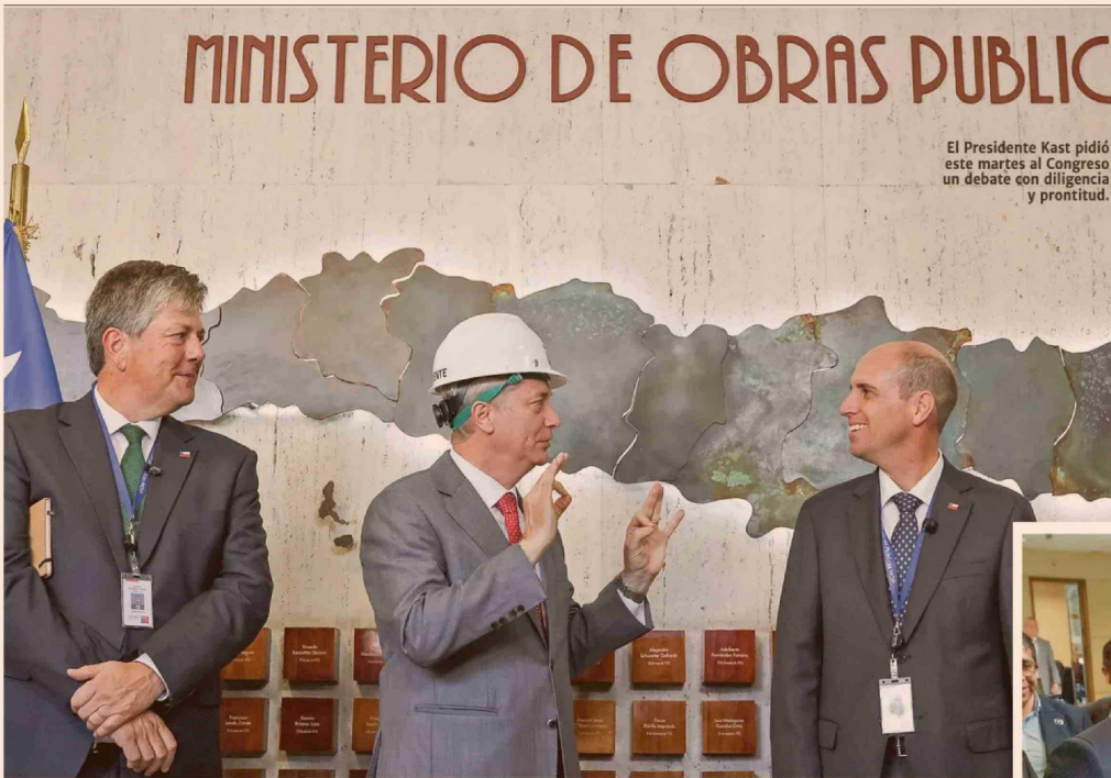
El Presidente Kast pidió este martes al Congreso un debate con diligencia y prontitud.