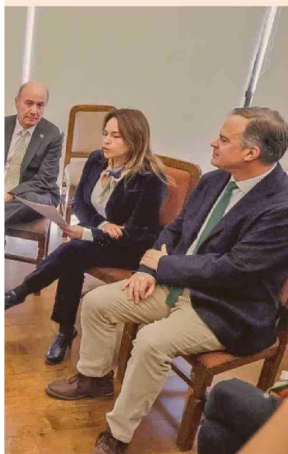
Los ministros Alvarado y Quiroz en conversaciones con parlamentarios de Demócratas.