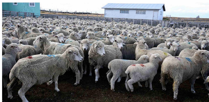
LA COMUNIDAD DE PORVENIR ESPERA REESTABLECER EL FUNCIONAMIENTO DEL MATADERO BAJO UNA COOPERATIVA PARA EL FAENAMIENTO LEGAL Y VENTA DE CARNE.

3.750 millones de pesos es la pérdida estimada debido al delito de abigeato.