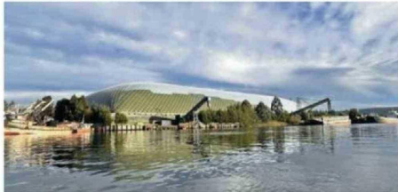
SE CAMUFLA EN EL ENTORNO PARA NO INTERRUMPIR EL PAISAJE.

la docente transformó esta gran infraestructura en un elemento que se integra armónicamente al ecosistema fluvial y urbano.