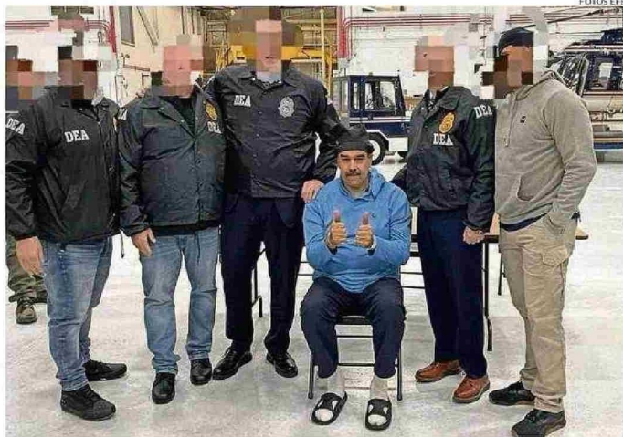
FOTO EN QUE SE MUESTRA A NICOLÁS MADURO EN SU LLEGADA A NUEVA YORK, DONDE SERÁ JUZGADO.

Hija de Jorge Antonio Rodríguez, dirigente comunista muerto en 1976 tras ser torturado bajo custodia policial, Delcy y su hermano Jorge, quien es el actual presidente del Parlamento, han construido su carrera política sobre un pilar emocional que analistas defi-