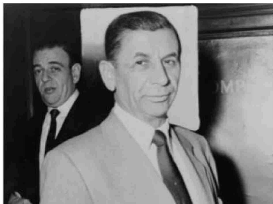
Meyer Lansky fue uno de los primeros socios de Lucky Luciano.