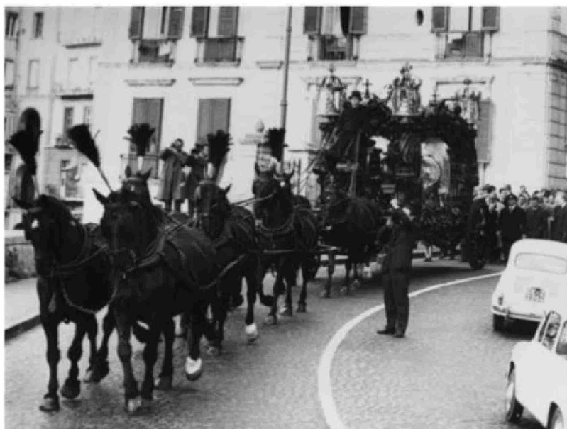
El cortejo fúnebre del entierro de Lucky Luciano.

Por fin, en 1954, la justicia italiana falló para que durante dos años se limitara el accionar de Luciano: debía presentarse ante la policía cada domingo, debía permanecer en su casa todas las noches y no podía dejar Nápoles sin autorización judicial. En 1929 Luciano había formado pareja con una bailarina de los clubes nocturnos de Broadway, Gay Orlova; nunca se casaron ni tuvieron hijos. En 1948, en Italia, formó pareja con Igea Lissoni, otra bailarina, italiana, veinte años