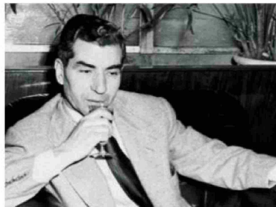
Luciano ayudó a mantener la calma en los muelles de Nueva York durante la Segunda Guerra Mundial.

Bajo el influjo de Luciano, la mafia de New York quedó en