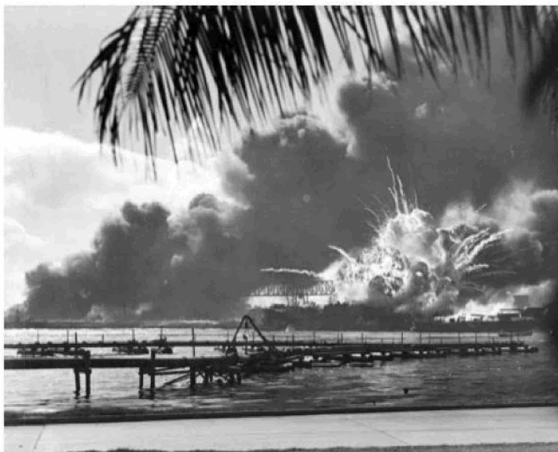
El ataque japonés a Pearl Harbor hizo que Estados Unidos ingresara a la Segunda Guerra Mundial.

Como la historia a menudo va de la mano con la ironía, fue