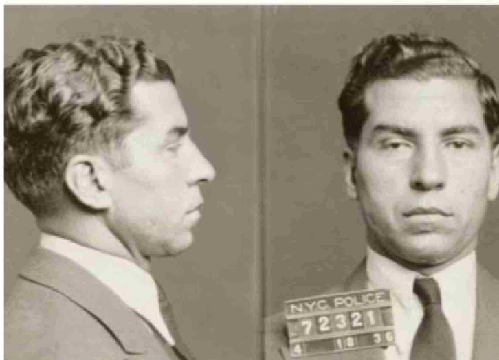
Lucky Luciano escaló posiciones dentro de las familias italianas que dominaban Nueva York.