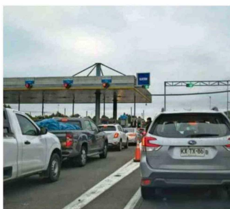
LOS PEAJES TRONCALES ACTUALMENTE CUESTAN $3.600.

La empresa que se adjudicará la concesión venidera, deberá ejecutar grandes mejoras. Las más importantes son la construcción de terceras pistas (en ambos sentidos) en 85 kilómetros, desde Victoria hasta el acceso norte de Temuco y desde el acceso sur de la capital regional hasta Gorbea; y la incorporación de un sistema de cobro electrónico sin pódicos manuales, es decir, el denominado