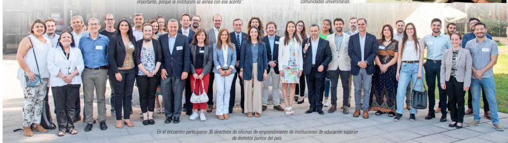
En el encuentro participaron 36 directivos de oficinas de emprendimiento de instituciones de educación superior de distintos puntos del país.