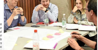
En el encuentro se realizaron mesas de conversación para generar un impulso que permita que, a través del trabajo colaborativo, se logre un crecimiento de las unidades de emprendimiento como vehículo para la creación de startups en las comunidades universitarias.