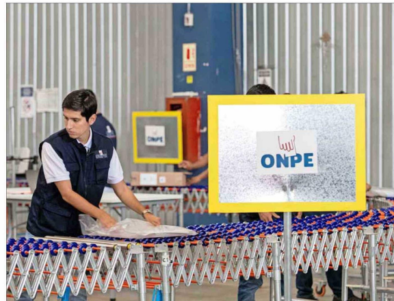
UN HOMBRE ORGANIZA el material electoral de cara a la primera vuelta en Perú.

“En muchos estudios hechos por Vox Populi hemos llegado a la conclusión de que el número real aproximado de indecisos es del 50% en el último mes antes de la elección, 25% a 30% en la última semana y 12% a 14% en el mismo día. En ese sentido, para elec-