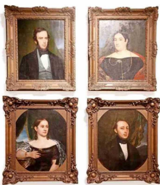
"Episodio Monvoisin" contempla gran diversidad de retratos hechos por el bordeles.

co. Y como muestra de su conexión con las temáticas de América se exhibe también "Caupolicán prisionero y Fresia" (1859), creada para el Salón de París. "Quienes vengan se asombrarán por los cambios de escala, desde la pequeña pintu-