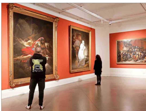
"Aristómenes" y "Blanca de Beaulieu", pinturas que Monvoisin elaboró en Europa hacia 1820, hoy se exponen en el MNBA.

Durante el recorrido, además de una cantidad importante de retratos solicitados por encargo a Monvoisin, aparecen obras que impactan por su factura y su grandísimo formato. Una de ellas es "Aristómenes", que el artista expuso en el Salón de París de 1824 y que hoy forma parte de la colección del Palacio Cousiño. Otra es "Cristo y Magdalena" (1852), que proviene de la Catedral Metropolitana de la Santísima Concepción y por primera vez se expone en un espacio lai-