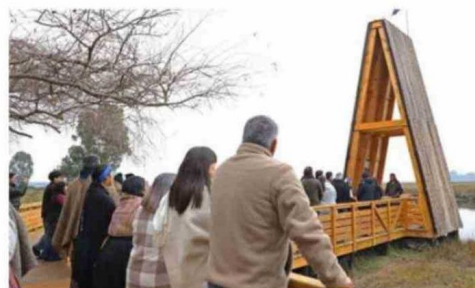
VARIOS HITOS SE CONMEMORARON EN LA PASARELA.