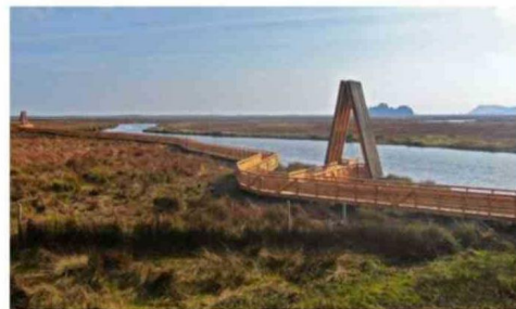
EL MAREMOTO DE 1960 DIO FORMA AL HUMEDAL DE MONKUL.

Además, forma parte de un circuito de pasarelas que inició con la entrega en julio de 2025 de la Pasarela Mirador Treng-Treng de Queule, financiada por el Ministerio del Medio Ambiente, el Fondo Conjunto de Cooperación Chile México, la Universidad Mayor y la Municipalidad de Tolten y que contó con el diseño del vicerrector Verdugo y su equipo. CS