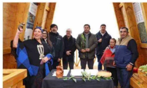
LA ACTIVIDAD CONTÓ CON UNA CEREMONIA TRADICIONAL.