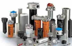
Filter desarrolla soluciones para procesos vinculados al cobre y el litio.

a resolver necesidades operacionales inmediatas de la industria minera. El sitio permite acceder a stock en tiempo real, procesos simplificados de compra y despacho prioritario directo a faena, facilitando la reposición rápida de productos Donaldson y otras marcas.