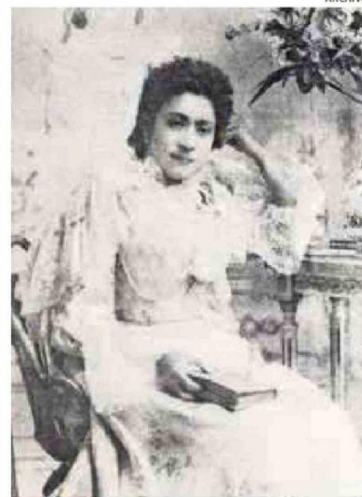
MIGUEL LUIS AMUNÁTEGUI FIRMÓ EL DECRETO EN 1877. ELOÍSA DÍAZ FUE LA PRIMERA EN TITULARSE, EN 1887.

6 de febrero de 1877 fue firmado el Decreto Amunátegui, por el entonces ministro de Justicia, Culto e Instrucción Pública.