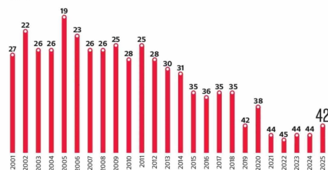
Evolución de Chile en Ranking de Competitividad Mundial Posición