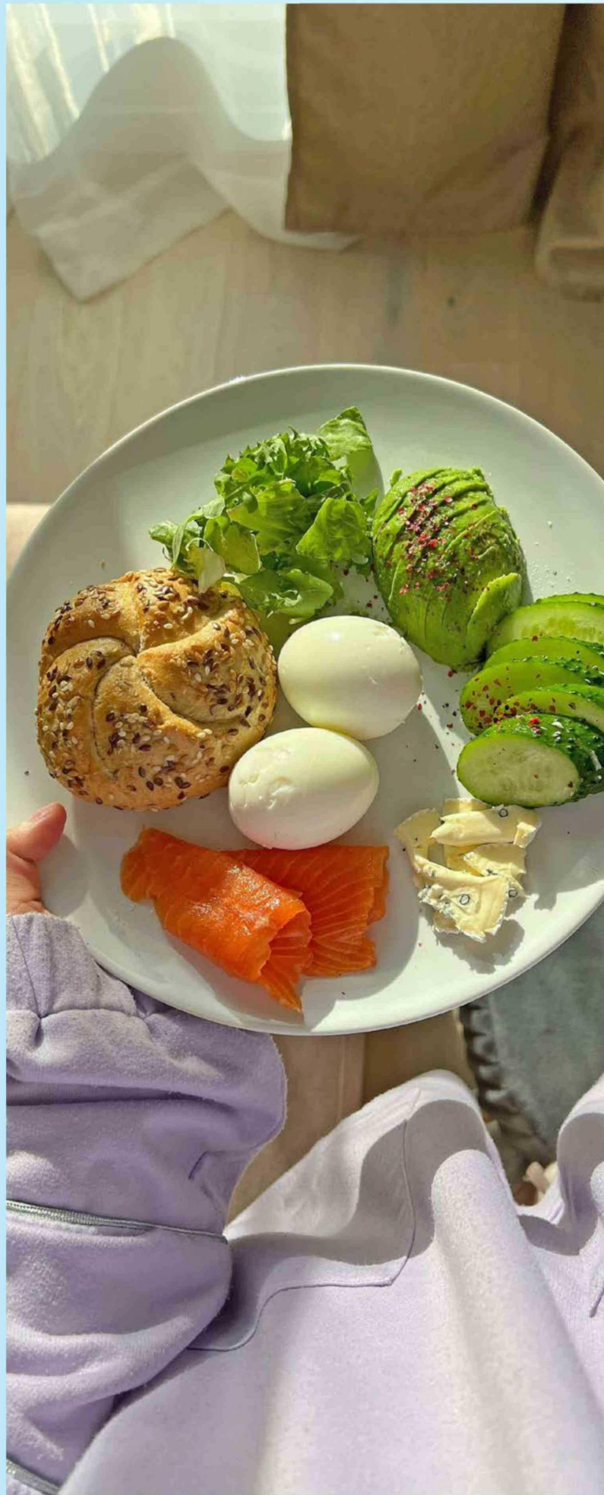
Está presente de forma natural en alimentos como huevos.