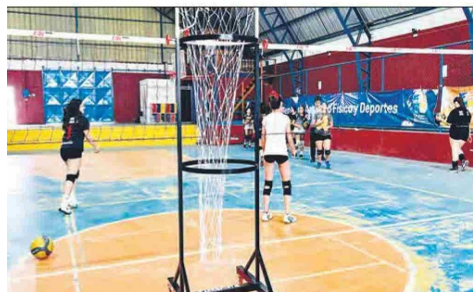
Los aros de precisión fueron adquiridos a través del Fondo Vecino Sopraval.