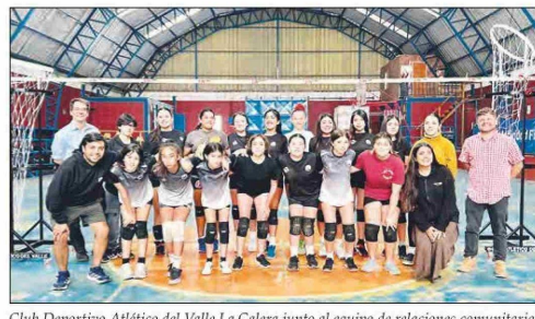
Club Deportivo Atlético del Valle La Calera junto al equipo de relaciones comunitarias de Sopraval.