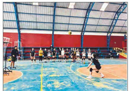
Las deportistas entrenan en recintos municipales de La Calera.