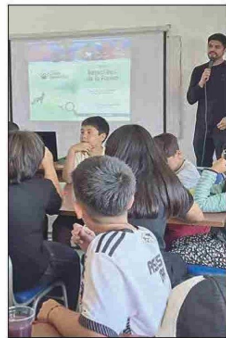
Durante la jornada, niños y niñas de la Escuela de Verano participaron en una charla interactiva orientada a fortalecer el cuidado del entorno natural y el respeto por la fauna local.

Desde la organización destacaron que el proyecto permitió generar conciencia ambiental en la comunidad, fortaleciendo el trabajo colaborativo entre el municipio, el sector privado y las organizaciones sociales, en favor de la sustentabilidad y el cuidado del territorio.