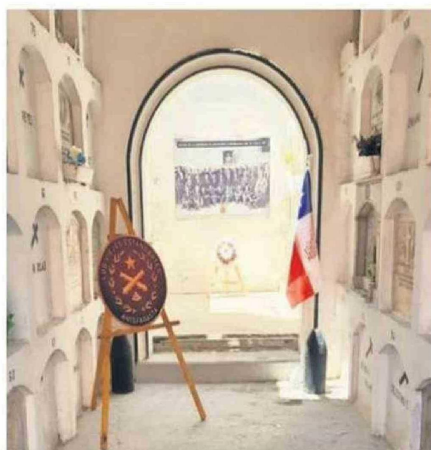
INTERIOR DEL MAUSOLEO A LOS VETERANOS EN ANTOFAGASTA.

del veterano se comenzó a conmemorar el 13 de enero de 1927, pero fue declarada oficial en 1926, por eso ahora conmemoramos el siglo. Esta fue una medida de retribución a lo excombatientes del 79, que para aquella década solo quedaban aún un tercio vi-