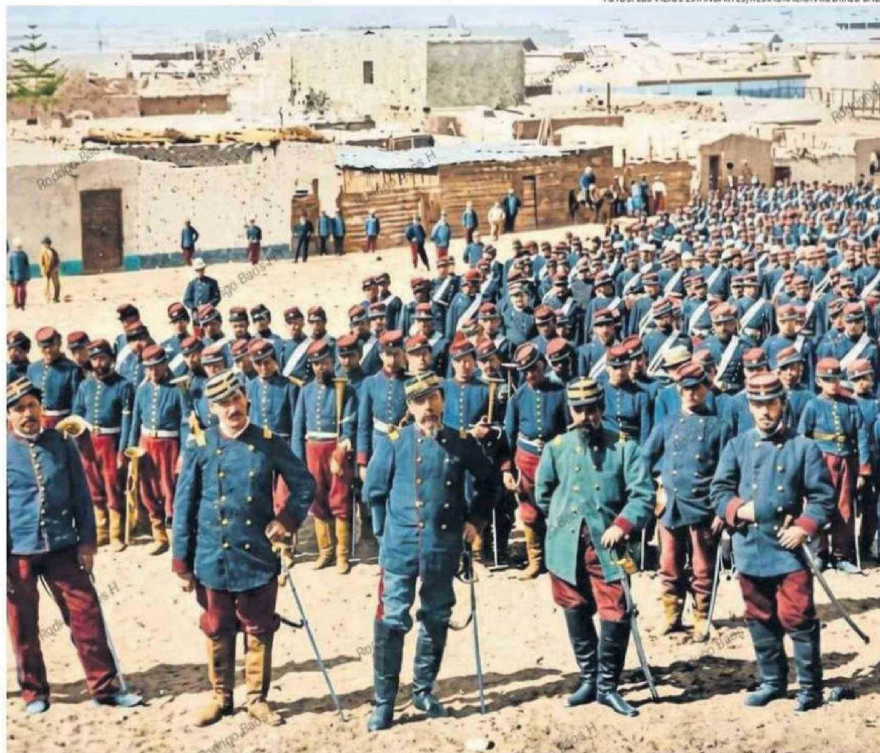
FOTO RESTAURADA DE OFICIALES Y SOLDADOS DEL EJÉRCITO DE CHILE EN ANTOFAGASTA, TRAS SU OCUPACIÓN MILITAR EN 1879.