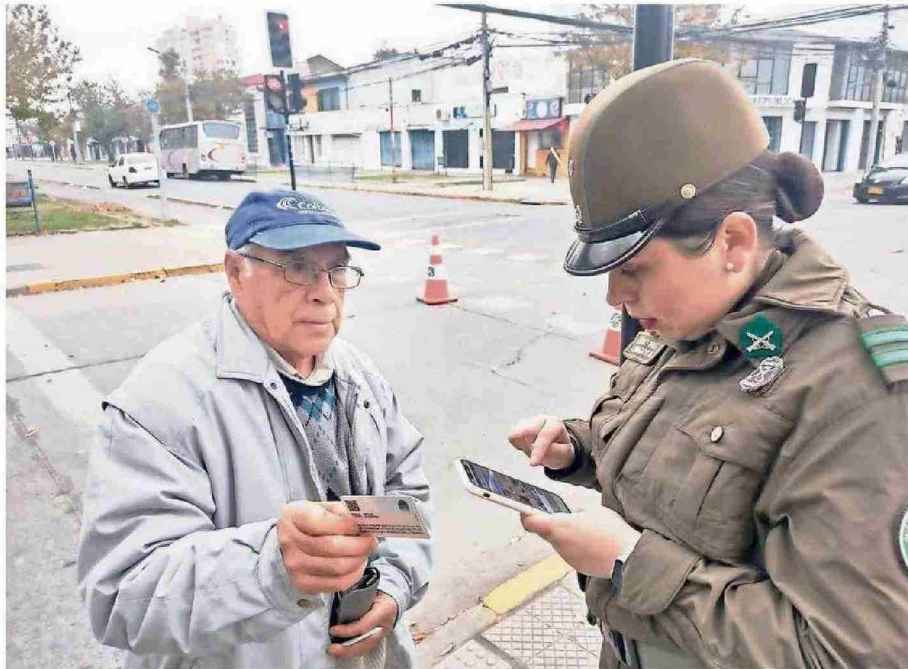
CARABINEROS ESTARÁ APOYANDO EL PROCESO ESPECIALMENTE EN EL PERÍMETRO EXTERIOR DE LOS ESTABLECIMIENTOS.

"Llamamos a todas y todos los habitantes de Ñuble y del país a que se informen, participen y acudan a las ur-