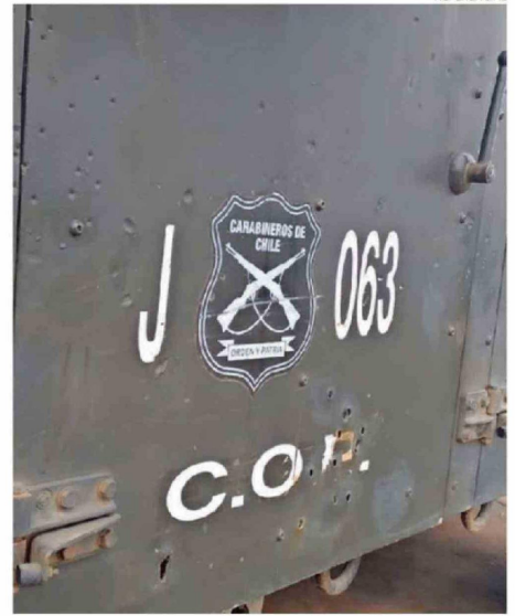
ABOGADA DIJO QUE LA CARABINERA HA SEGUIDO SUFRIENDO HOSTIGAMIENTO.