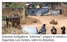
Actuaron investigadores "externos", asegura el ministro de Seguridad, Luis Cordero, sobre los disturbios.

Un año y 10 meses después de que la Corte Suprema ordenara el lanzamiento y tras la polémica por la decisión del Gobierno de expropiar 110 hectáreas del predio se dio inicio a las labores para expulsar a los ocupantes que permanecían en el lugar.