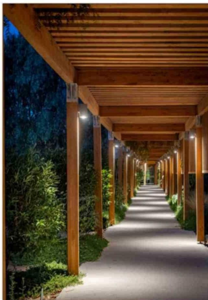
Uno de los énfasis de la remodelación fue entregar mayor calidez al lugar, por eso se agregaron corredores de madera.

minaciones. Cuando se arman tienen una forma parecida a un container, pero no lo son", dice.