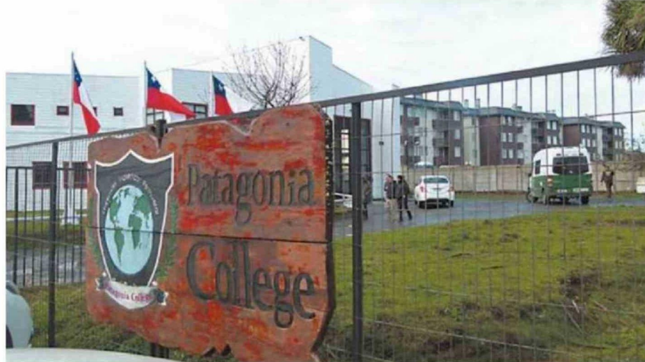
HACE SIETE AÑOS SE REGISTRÓ UN GRAVE EPISODIO DE VIOLENCIA ESCOLAR EN EL PATAGONIA COLLEGE DE LA CAPITAL REGIONAL.

En Puerto Montt, el Daem implementó el programa "Comunidades Libres de Violencia" en sus 75 establecimientos, también en respuesta a los hechos ocurridos en Calama. El