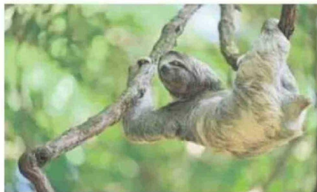
Perezoso de tres dedos en Costa Rica.