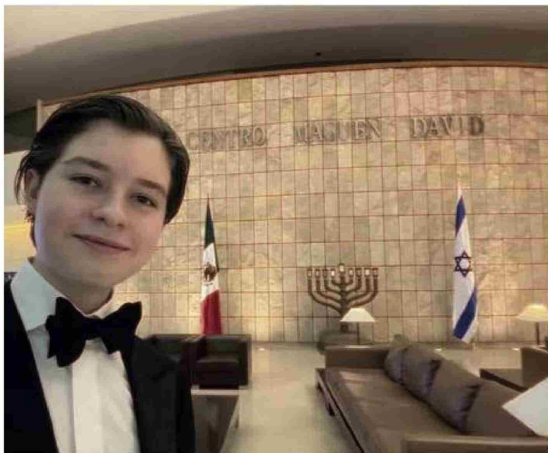
Además de sus estudios, promueve programas educativos para jóvenes con altas capacidades intelectuales.

Un año más tarde, ya con doce años, finalizó una maestría en física cuántica y comenzó un doctorado. Su formación académica se entrelaza con proyectos de investigación en Estados Unidos, Canadá, Israel, Alemania y Japón, y su trabajo incluye colaboraciones con el Instituto Max Planck de Óptica Cuántica, donde participó en el desarrollo de tecnologías láser aplicadas al diagnóstico médico.