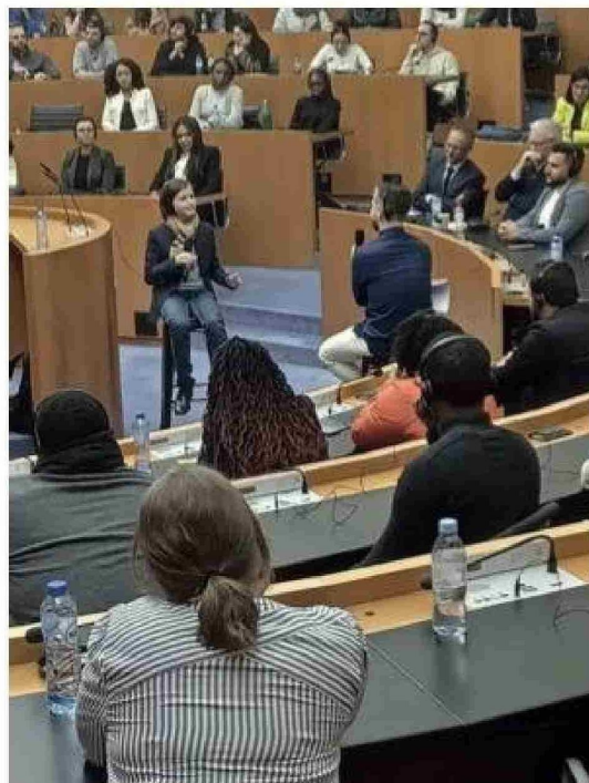
A pesar de su trayectoria, disfruta de videojuegos, karting y amistades, equilibrando sus intereses personales con la ciencia.