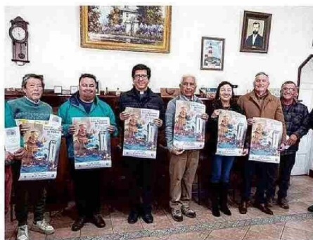
EL MUNICIPIO LANZÓ LAS ACTIVIDADES JUNTO A LA PARROQUIA.