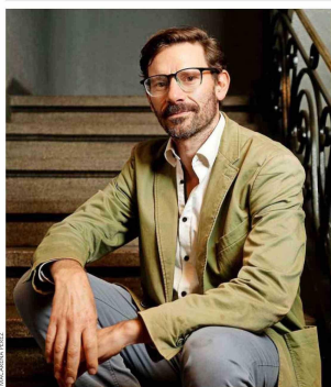
MATÍAS MEZA-LOPEHANDÍA: LA RECONVERSIÓN DE UN EXASADOR PRESIDENCIAL PÁGINA 6