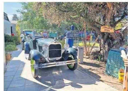
EN FREIRINA SE VIVIÓ CON NOSTALGIA.

organizadas por la oficina de Cultura, Oficina de Turismo y la Biblioteca de la Dideco de la Municipalidad de Caldera, CIAHN ATACAMA, Oficina de Pueblos Originarios, Agrupación Cultural Wheelwright, los calderinos y visitantes pudieron disfrutar del Día del Patrimonio en el puerto de Caldera durante estos días.