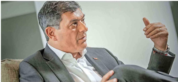
FRANCO PARISI Y EL APOYO DEL PDC A LA "LEY DE RECONSTRUCCIÓN":

“Al ministro Jorge Quiroz lo respeto intelectualmente, nos conocemos hace mucho” D 3