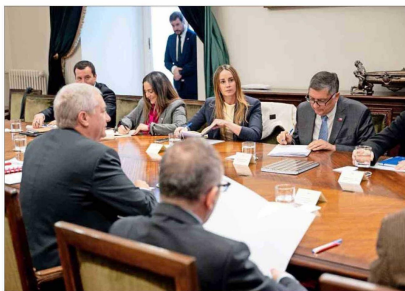
El Presidente Kast lideró el comité político ayer en La Moneda. Más tarde, se realizó la reunión "ampliada" con los partidos del oficialismo.

DC no aprobará idea de legislar y PPD está a la espera Sin embargo, el trámite del proyecto de Reconstrucción se complicó repentinamente. Porque la DC y el PPD —dos partidos