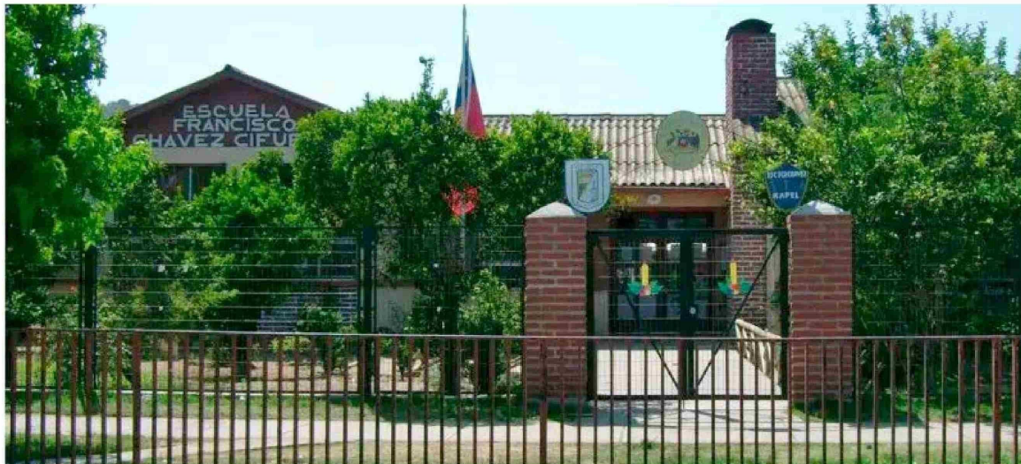
Escuela Francisco ChavezCifuentes