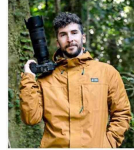
AUTOR. Benjamín Valenzuela Wallis planea terminar esta ruta en agosto.