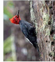
VIDA. El bosque de China Muerta se ha ido recuperando tras el incendio de 2015.

"Nosotros fuimos ahora en verano y llegamos en auto a la entrada misma de la reserva (en invierno puede ser más complejo, cuando cae nieve). Dentro de la reserva está el cálido Refugio Mocho-Choshuenco , donde puedes acampar o quedarte en una tiny house que tienen allí. El refugio está asociado al Club Andino de Valdivia.