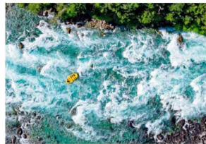
AVENTURA. Ir a los miradores de la Reserva Futaleufú es un gran complemento a los clásicos descensos en rafting.