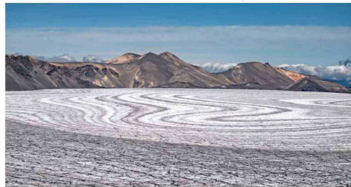
HIELO. El cráter del volcán Sollipulli, que forma parte de la Reserva Nacional Villarrica, está cubierto por un glaciar. Esta ruta se puede seguir con más detalles en el canal de YouTube de Benjamín Valenzuela Wallis.