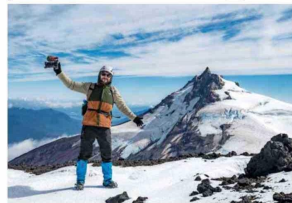
POSTAL. El fotógrafo con el volcán Choshuenco de fondo. Ahora hay un nuevo camino de acceso a esta reserva.