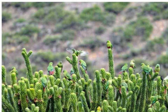
ALTO BIOBÍO. Ubicada en La Araucanía andina, cerca del paso Pino Hachado, esta reserva tiene un paisaje más de estepa patagónica. También existe gran variedad de aves.

“No me gusta comparar, pero isla Mocha es como una mini isla Robinson Crusoe: tiene paisajes con cerros y planicies. Y además una historia literaria, en este caso ligada a Moby Dick. Es un lugar que merece ser visitado”. D