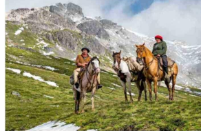
LAGO PALENA. A esta reserva nacional se llega a caballo. El viaje dura unas ocho horas y se hace con arrieros.

"Visitar esta reserva entrega muchas enseñanzas: la principal es que ves en terreno lo dañina que puede ser la acción humana y la importancia de seguir las normas y cuidar estos lugares. Un incendio arrasó con gran parte de estos bosques de araucarias en marzo de 2015, pero se ha ido recuperando. La resiliencia que tienen estos árboles, su capacidad para sobrevivir a catástrofes de esta magnitud, es impresionante.