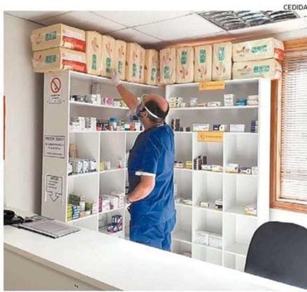
SAN PABLO ES LA SEGUNDA COMUNA EN LA PROVINCIA CON ESTE SERVICIO.

En el establecimiento de la capital provincial, ubicado en avenida Mackenna, se habilitó la venta online (internet) y posterior entrega a domicilio de los fármacos; mientras que en el recinto de San Pablo la distribución domiciliaria es exclusivamente para adultos mayores y pacientes crónicos que no cuentan con una red de apoyo. En las farmacias vecinas la