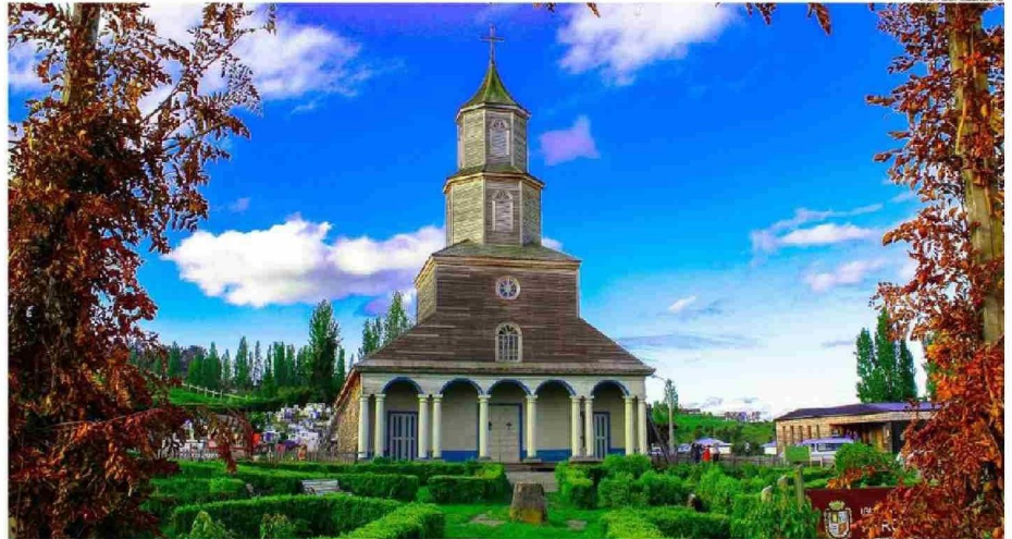
EN EL ARCHIPIÉLAGO DE CHILOÉ, LOS ATRACTIVOS SON MÚLTIPLES, COMO SUS TRADICIONALES IGLESIAS, MUCHAS PATRIMONIO DE LA HUMANIDAD.

Agregó que era necesario avanzar en mejorar las condiciones estéticas y de seguridad en toda la comuna, por lo que han trabajado en dejar las calles libres de comercio ambulante, limpiar las fachadas de edificios públicos y privados con apoyo de sus dueños, ordenar la ciudad con mayor señalización e información de fácil