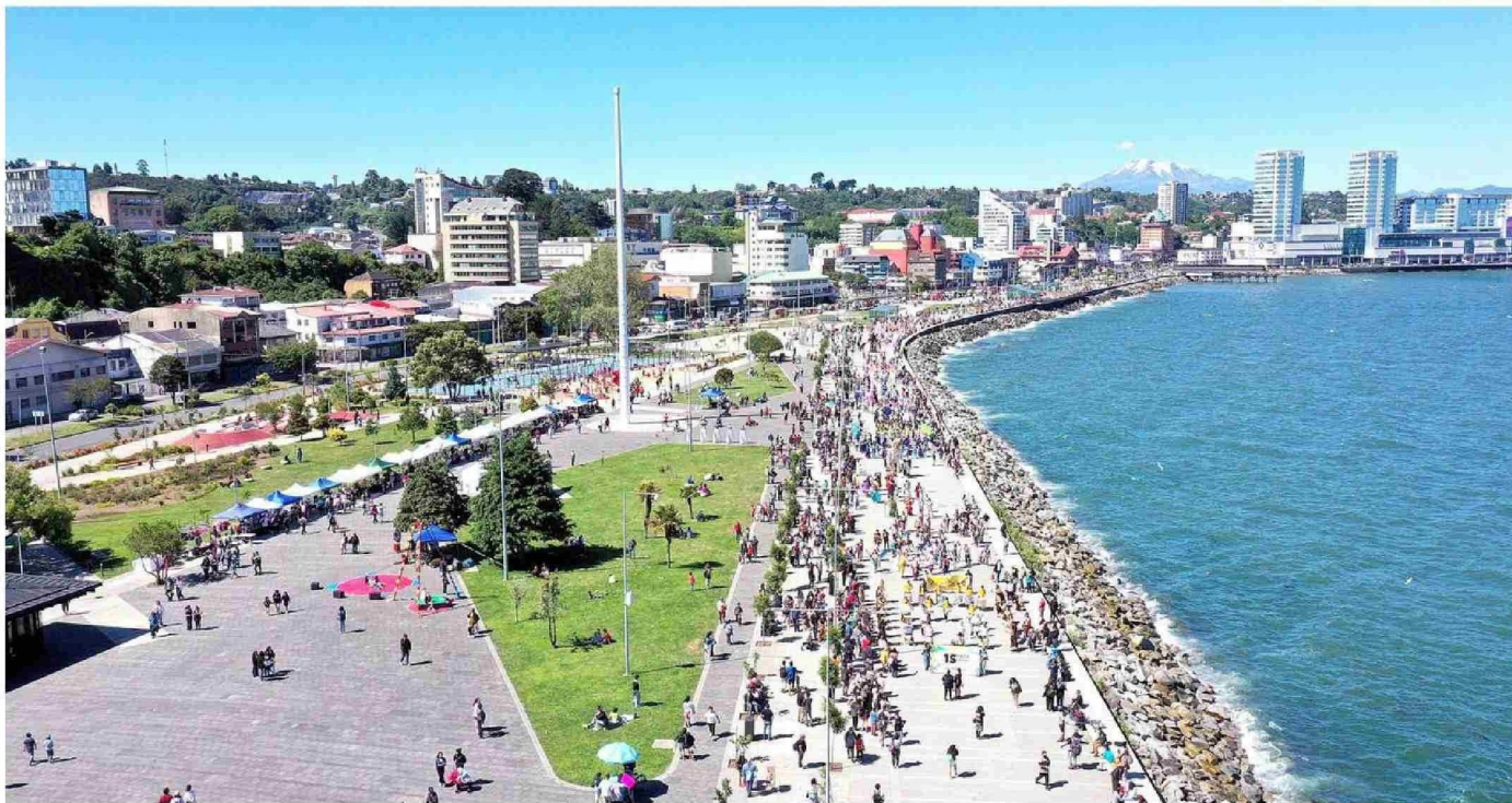
PUERTO MONTT ES UNA MEZCLA ENTRE POTENCIA TURÍSTICA Y CAPITAL REGIONAL. AQUÍ NACE LA CARRETERA AUSTRAL, UN LUGAR DE AMPLIA OFERTA EN MATERIA DE BELLEZA ESCÉNICA.

Tiraje: 6.200 Lectoría: 18.600 Favorabilidad: No Definida