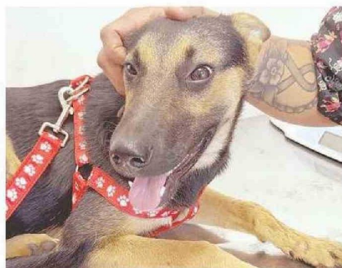
CON UN POQUITO DE CARIÑO RECUPERÓ EL ÁNIMO.

mos actuar rápido", señaló el profesional.