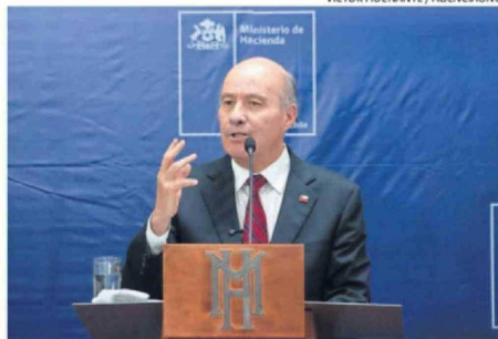
QUIROZ SUMÓ MEDIDAS A LAS ANUNCIADAS POR KAST.

discusión menos que vamos a tener en el Congreso".