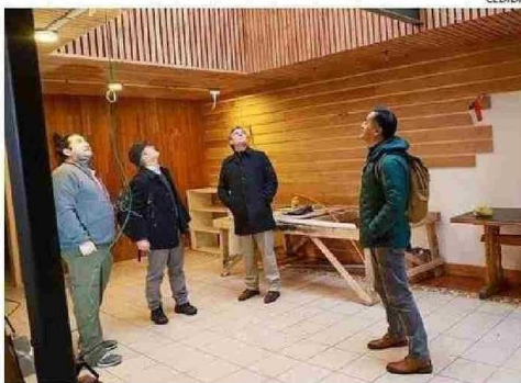
VISITA DE DELEGACIÓN DE LA FUNDACIÓN TELETÓN, EN MAYO DE 2024, AL EDIFICIO DONDE SE PRETENDÍA INSTALAR EL CENTRO PROVISIONAL, EN CALLE LILLO, SECTOR PORTUARIO CASTREÑO.

Tiraje: 2.800 Lectoría: 8.400 Favorabilidad: No Definida