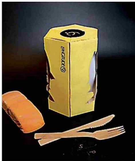
El primer lugar fue para "Longitude 9°", del equipo IAMCLIMATE, un packaging vertical de tres compartimentos que optimiza transporte, reduce residuos y es compostable.